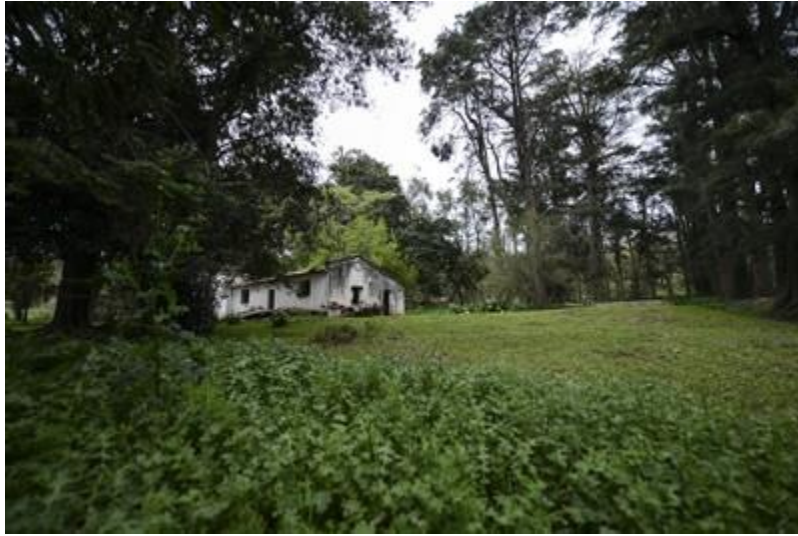
Monte Peloni, Olavarría.