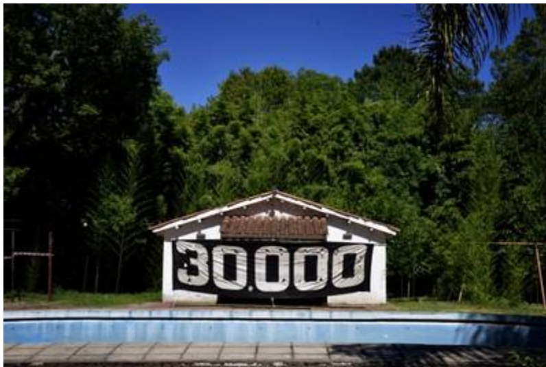
Quinta de Funes, Rosario.