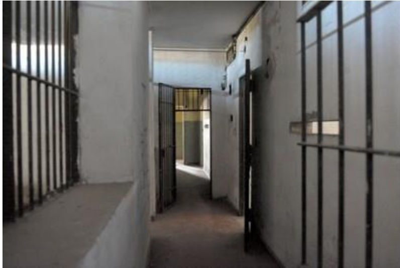
Pozo Banfield, Banfield.