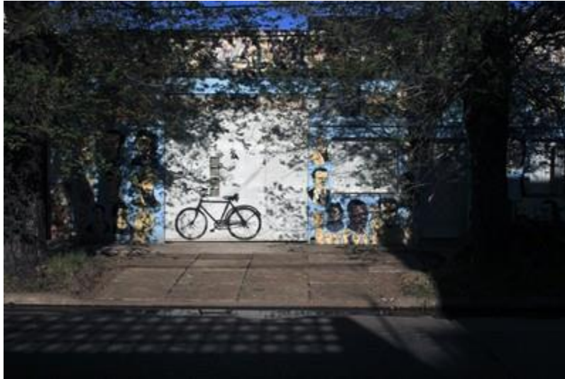
La Casita de los ciegos, Rosario.