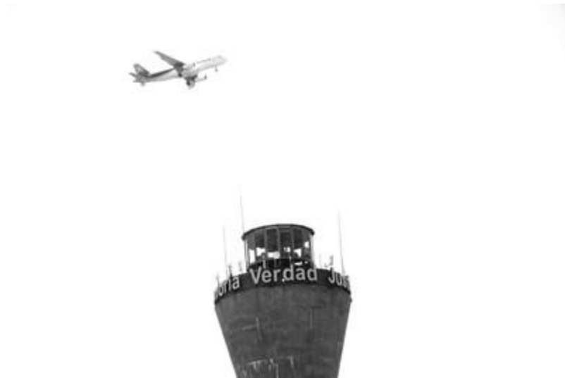
Escuela Mecánica de la Armada (ESMA) C.A.B.A.