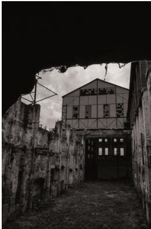
Santa Lucía, Tucumán.