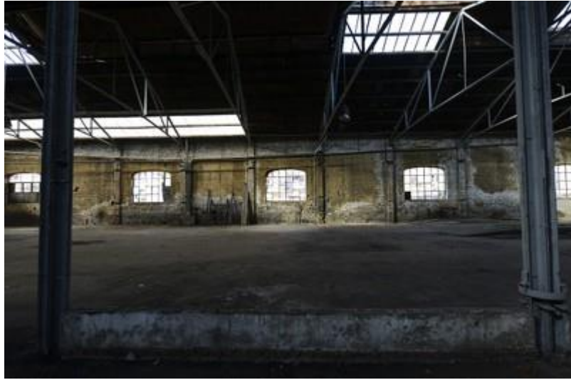
Olimpo, C.A.B.A.