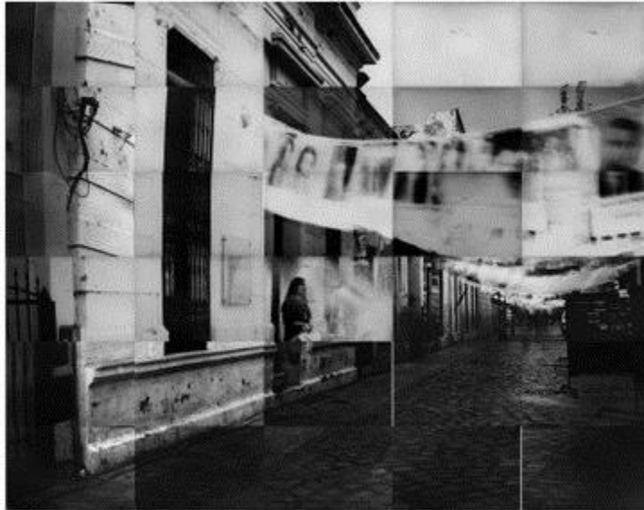
Departamento de Informaciones de la Policía de Córdoba (D2), Córdoba.