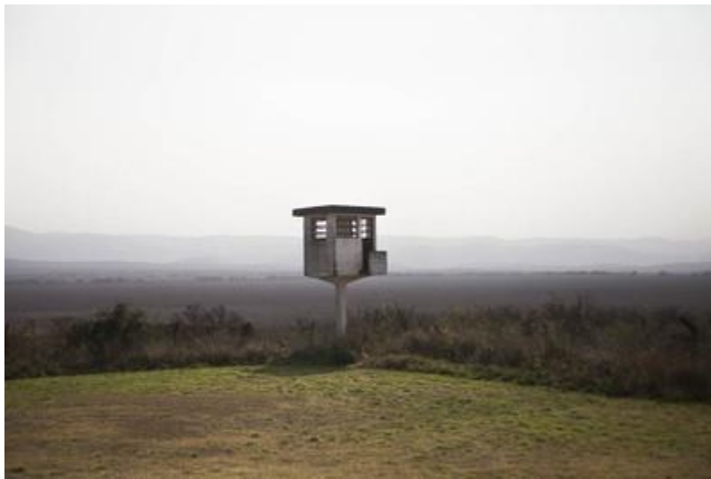
La Perla, Córdoba.