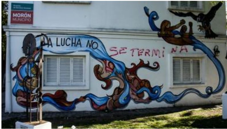
Mansión Seré, Morón.