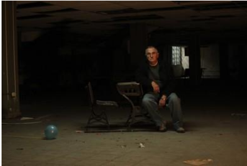
Duri, ex detenido desaparecido. Antigua Comisión Vigil.