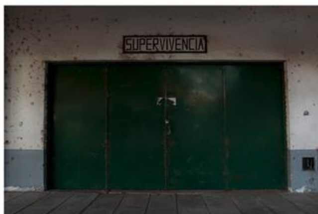
Escuela de Mecánica de la Armada (ESMA), C.A.B.A.