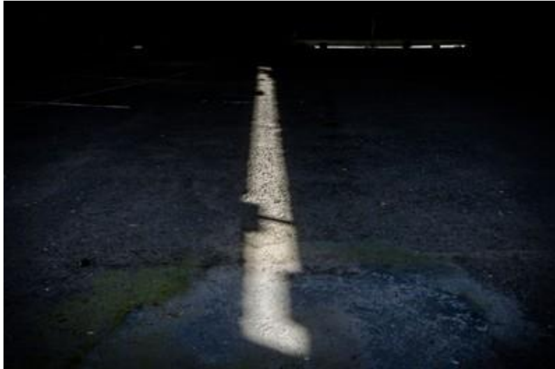
Olimpo, C.A.B.A.