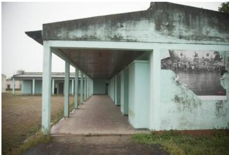
Escuelita de Famaillá, Tucumán.