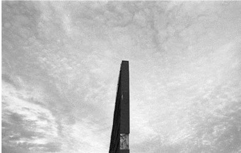
Parque de la Memoria, C.A.B.A.