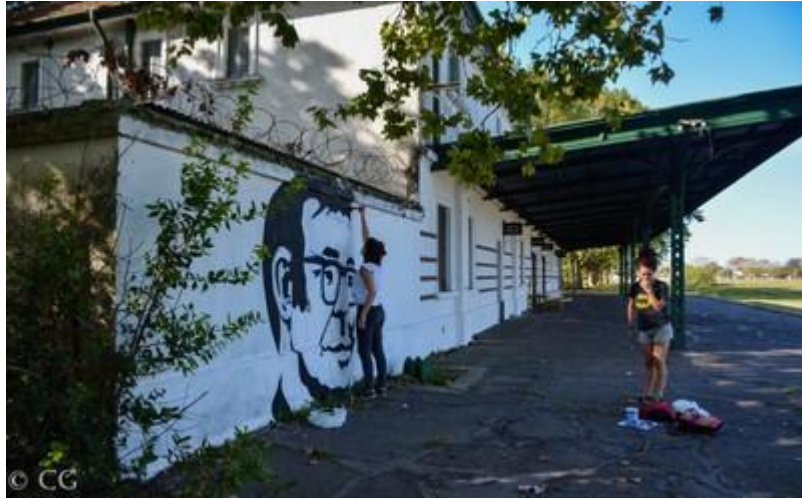
Casa Rodolfo Walsh, San Vicente.