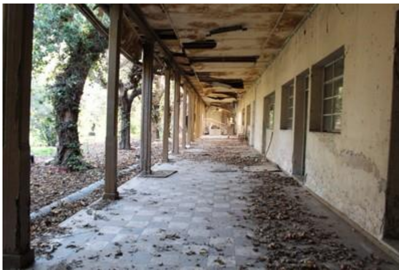
Comisaría de Mendoza.