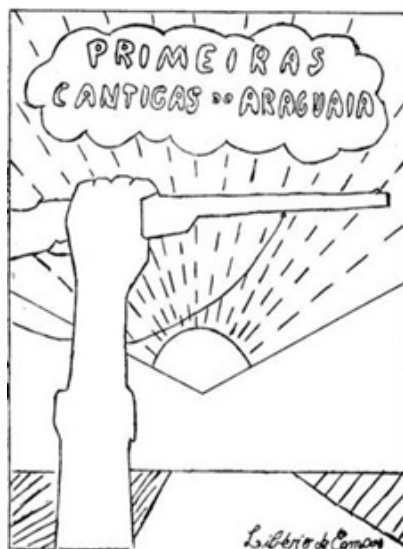
Figura 3 – Capa de Primeiras Cantigas do Araguaia