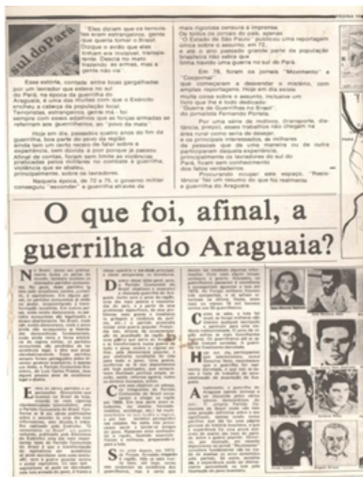
Figura 1 – Resistência (Edição Extra N° 3), 11-1979